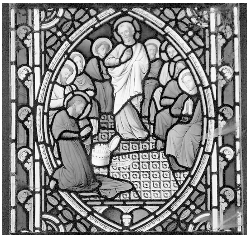
La elección de Matías como uno de los Doce. Iglesia de St Mor and St Deiniol, Llanfor, Gwynedd, Gales.

ñoso calificarlo de poco importante. Si la gran mayoría de nuestra vida transcurre entre un hito y otro, va a resultar que esa es la situación más importante.