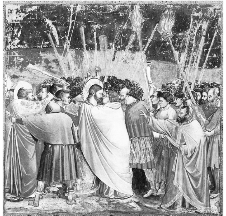
El beso de Judas. Pintura al fresco, Giotto, hacia 1306.

Una luz de tintes naranja rojizos se esforzaba por alumbrar entre la niebla matinal mientras descendía al Gehenna. Hoy este valle es una zona de conflicto en la batalla campal entre la población palestina y los colonos judíos. Entré con algo de aprensión, la mente turbada tanto por los peligros