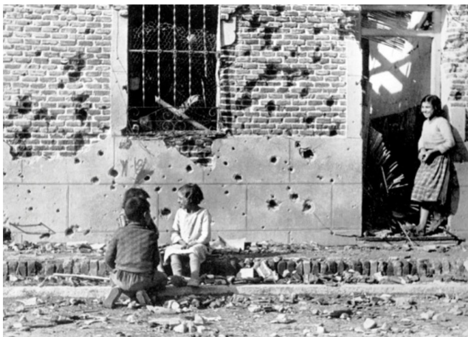
Guerra Civil Española

Y creo que si olvidamos agradecer a Dios permanentemente el habernos concedido el privilegio de vivir en una generación de paz, nuestras oraciones se pueden tornar injustamente quejosas e ingratas.