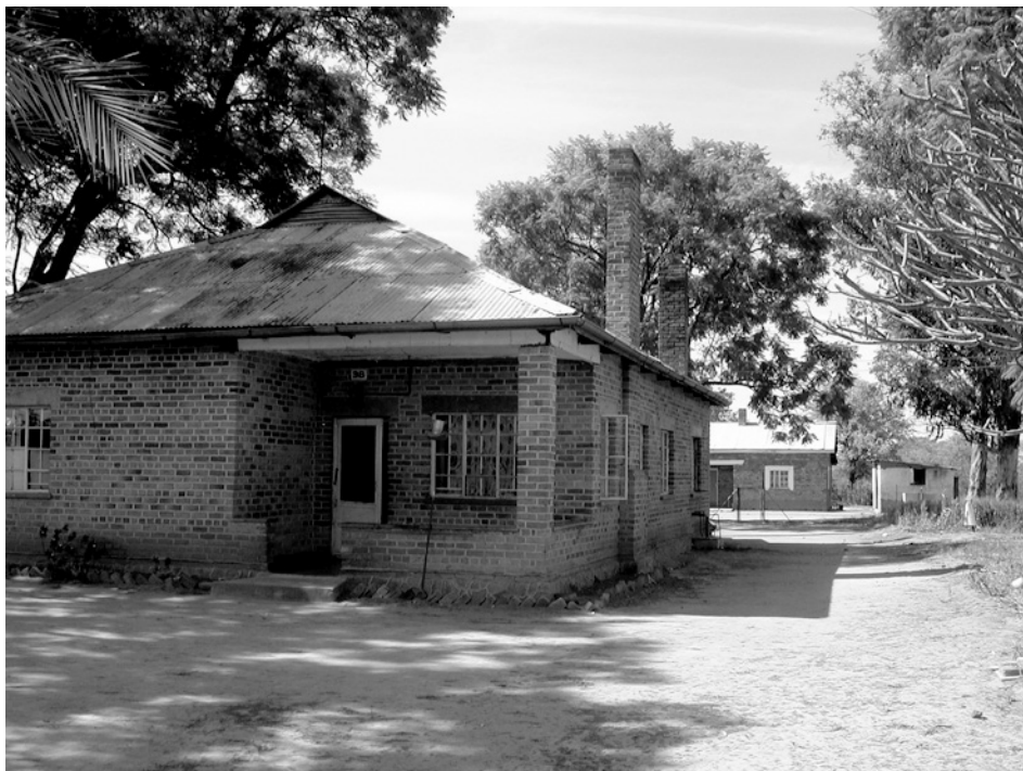
Hospital de la Misión Mtshabezi, de los Hemranos en Cristo en Zimbabwe