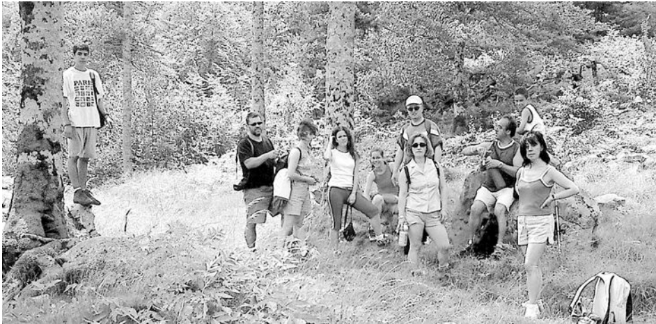
Arriba: Excursión de senderismo durante la acampada anual, iglesia de Burgos. Abajo: Contra Corriente , un descanso a la sombra.