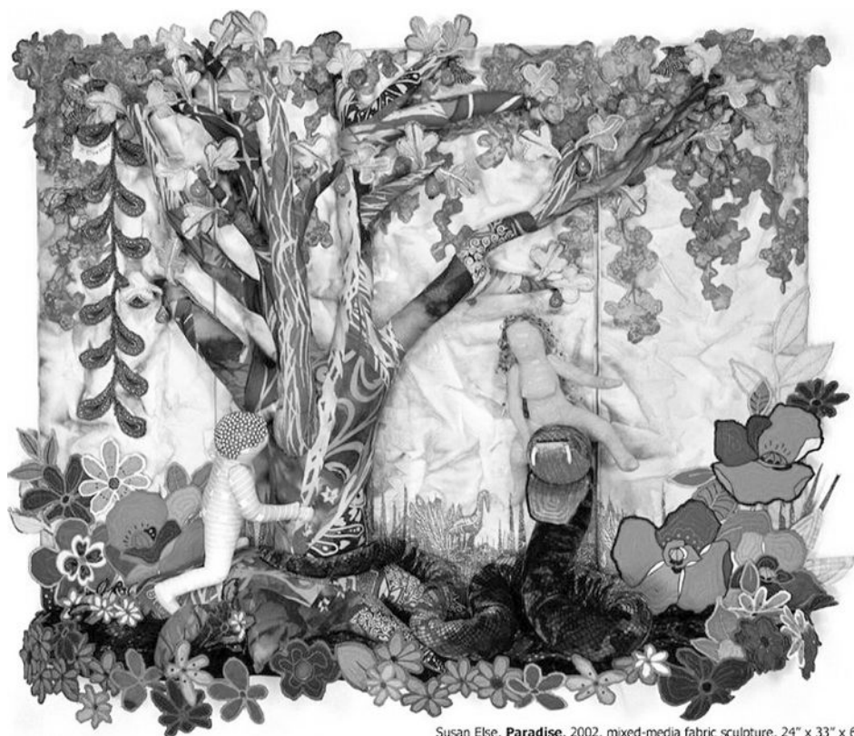
Susan Else, Paradise , 2002, mixed-media fabric sculpture, 24" x 33" x 6"

El paraíso, según la escultora Susan Else, 2002