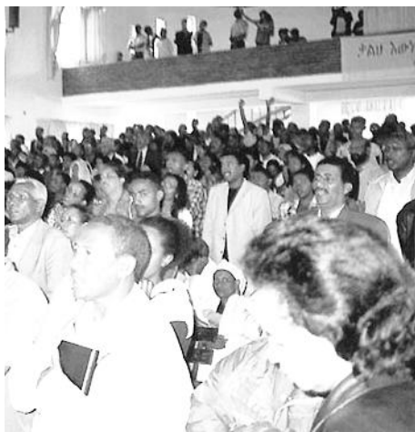
Vista parcial de los asistentes a una reunión en la iglesia de Misrach, en Addis Ababa.