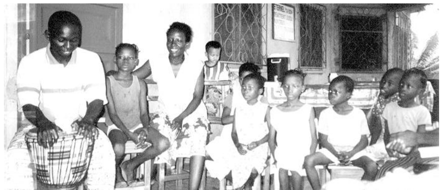
En el porche de “La Casa Grande”

Por la noche hay una fiesta donde se reparten regalos llevados de