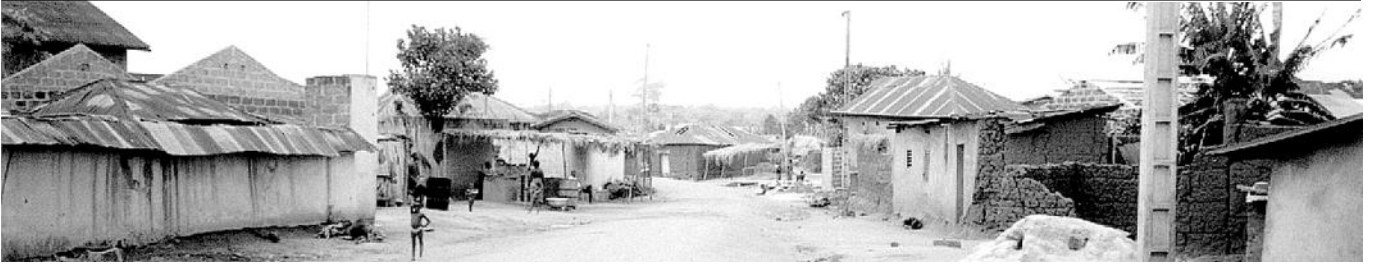
Poblado de Togudú