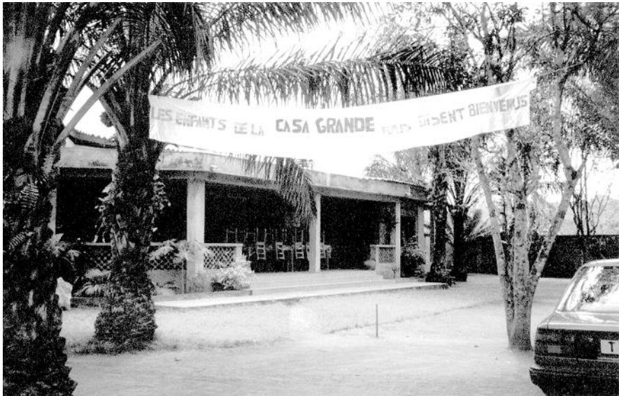
“Los niños de La Casa Grande os dan la bienvenida”

Domingo 24: Fotos de los niños para información a padrinos. Viajamos a Cotonou donde participamos en el culto de la iglesia que tiene en su estudio el arquitecto Capo Chi-