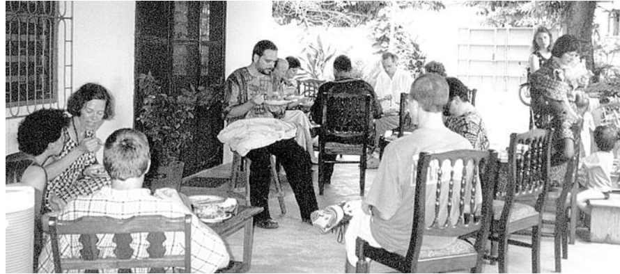
Con los misioneros menonitas norteamericanos

dos canciones y al final prediqué por unos 30 minutos. Al final del culto tuvimos una reunión con el equipo directivo de la iglesia.